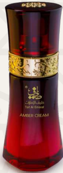
كريم عنبر Amber Cream