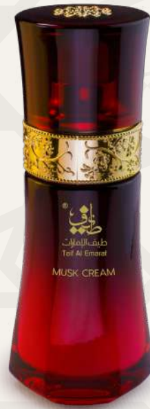
كريم مسك Musk Cream