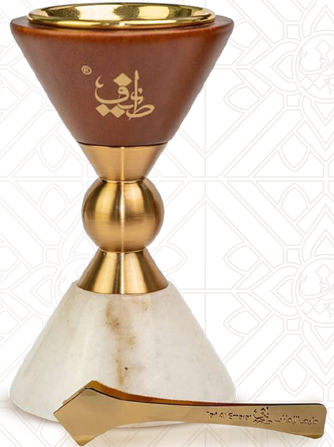
■ مبخرة رخامية