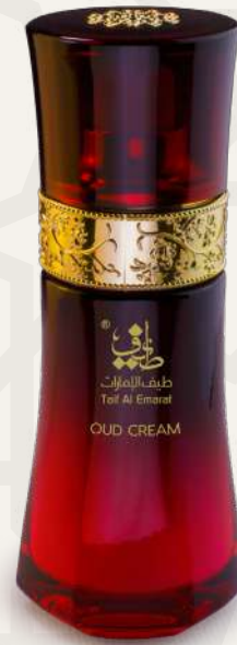
كريم ورد Roses Cream