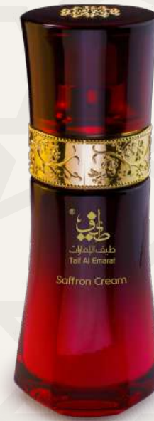
كريم زعفران Saffron Cream