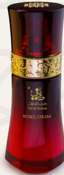
كريم عود Oud Cream