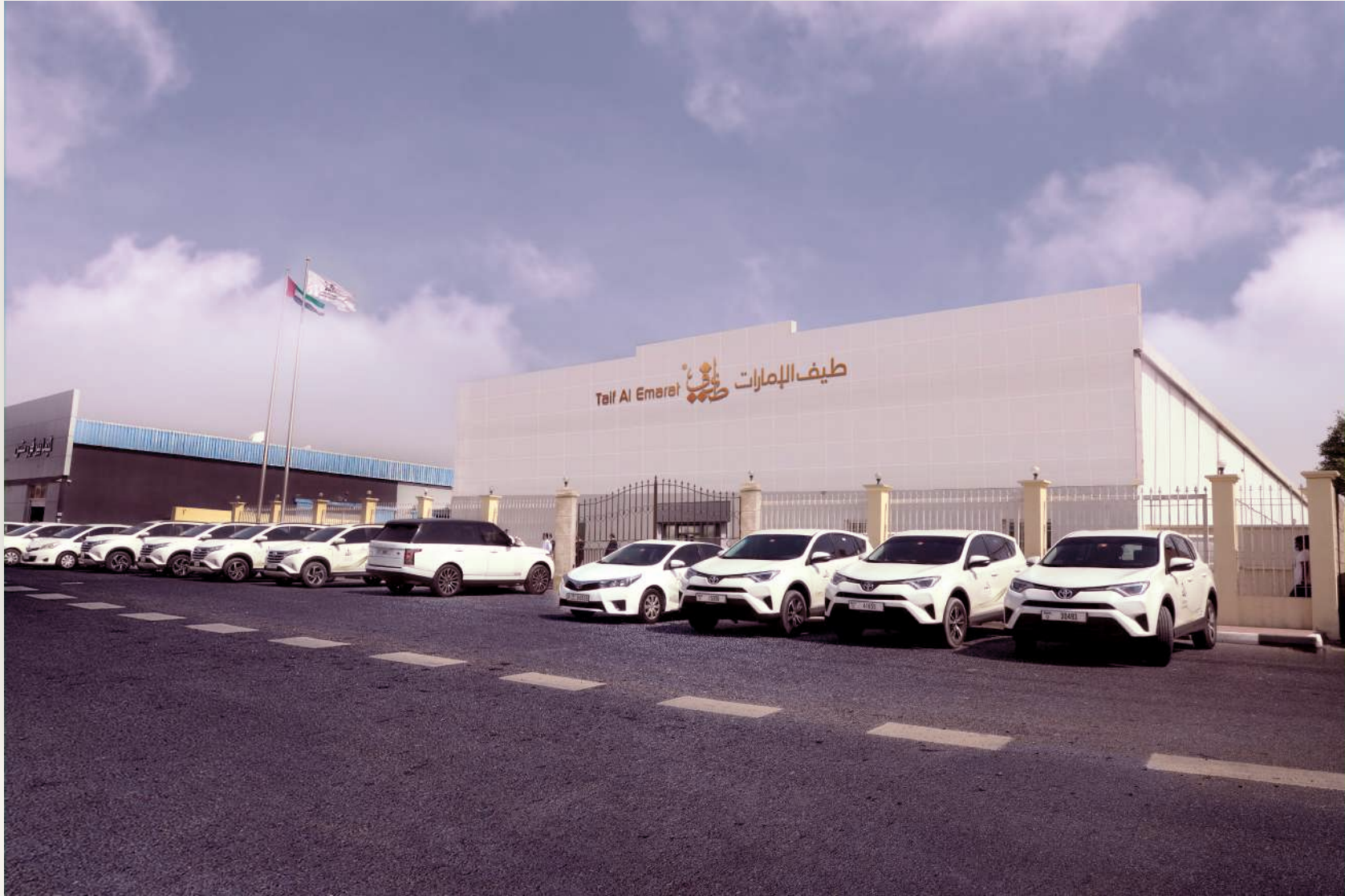
مصنع طيف الإمارات Taif Al Emarat Factory